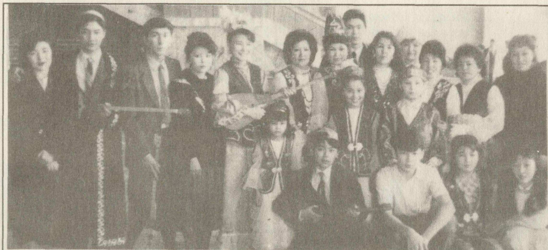
Участники фестиваля "Жалынды Жастык" в Омске

Сегодня главная забота - это решение проблемы национального и культурного возрождения и развития сибирских татар. И без создания профессионального плацдарма в национальной си-