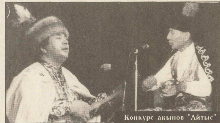
Конкурс акынов "Айтыс"